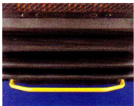
Réglage AV / AR